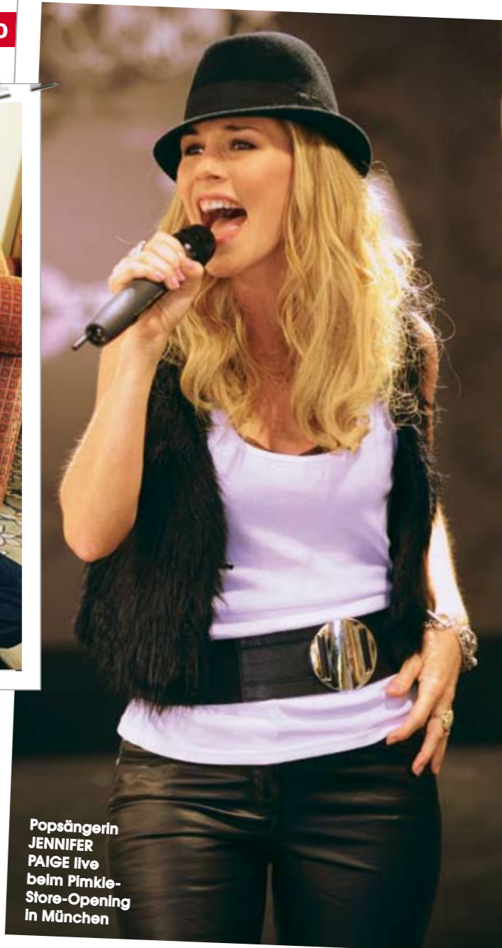
Popsängerin JENNIFER PAIGE live beim Pimkie-Store-Opening in München